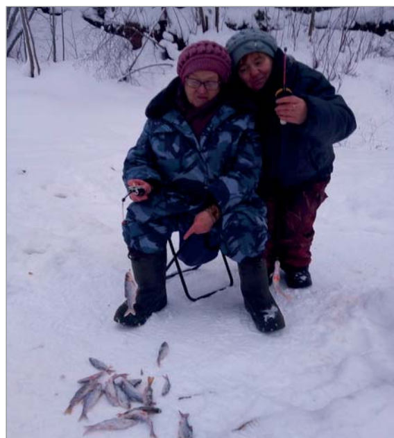
Хобби ветеранов Прилузья.