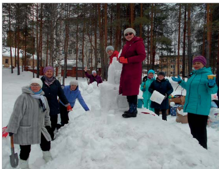
Снежные скульптуры. Ухта.