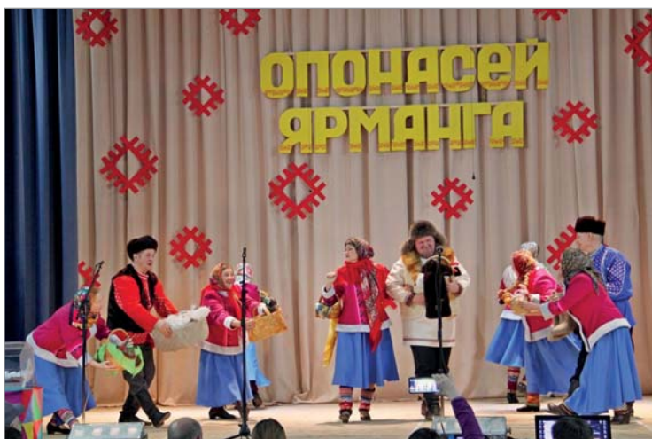
Ветераны Корткероса зажигают.