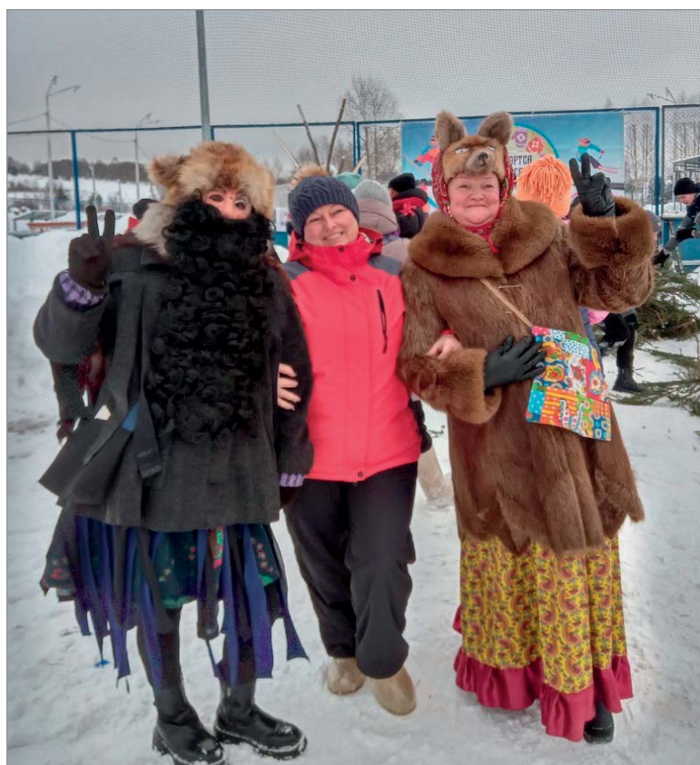
Вспомним детство золотое! Ветераны Койгородка на молодежных играх.