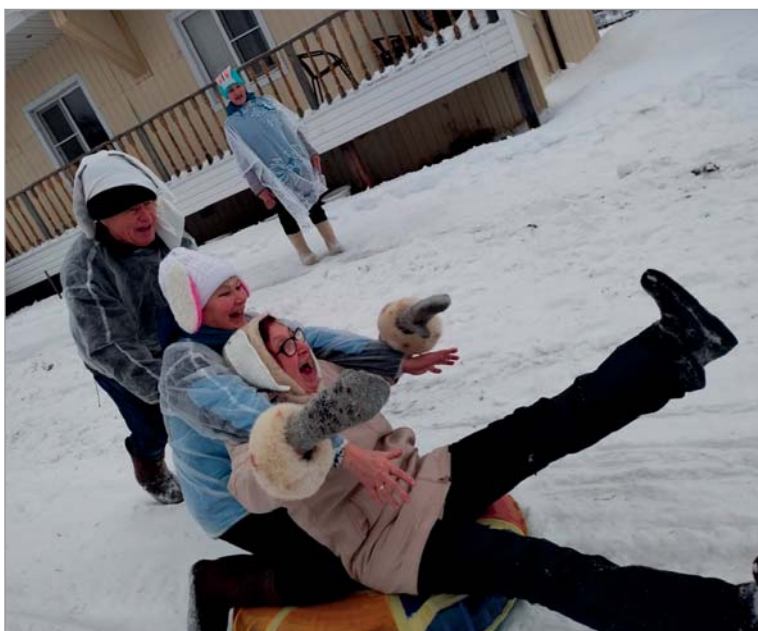
Сторонись, народ! По-ехали! Сторожевск.