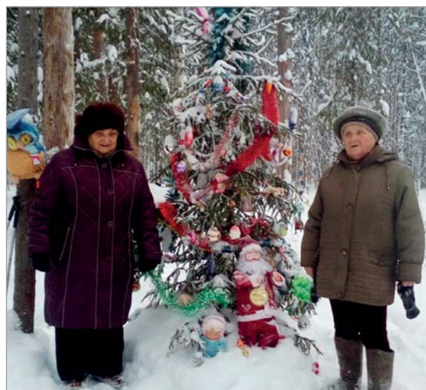
С Новым годом, Тайга! Ярега.