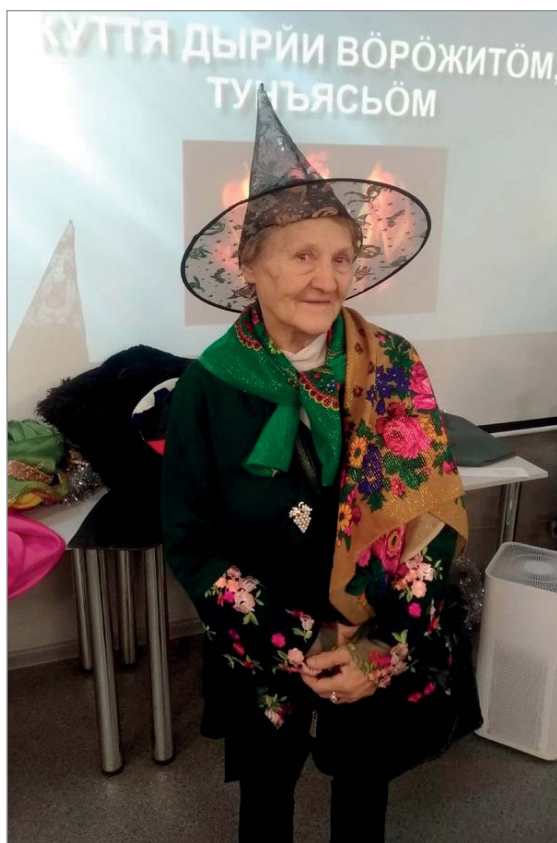
Весело покаядовали. Эжва.