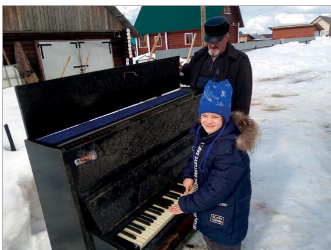
Сюрприз для дедушки. Объячево.