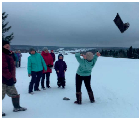
Кидание валенок. Пожег Усть-Куломского района.